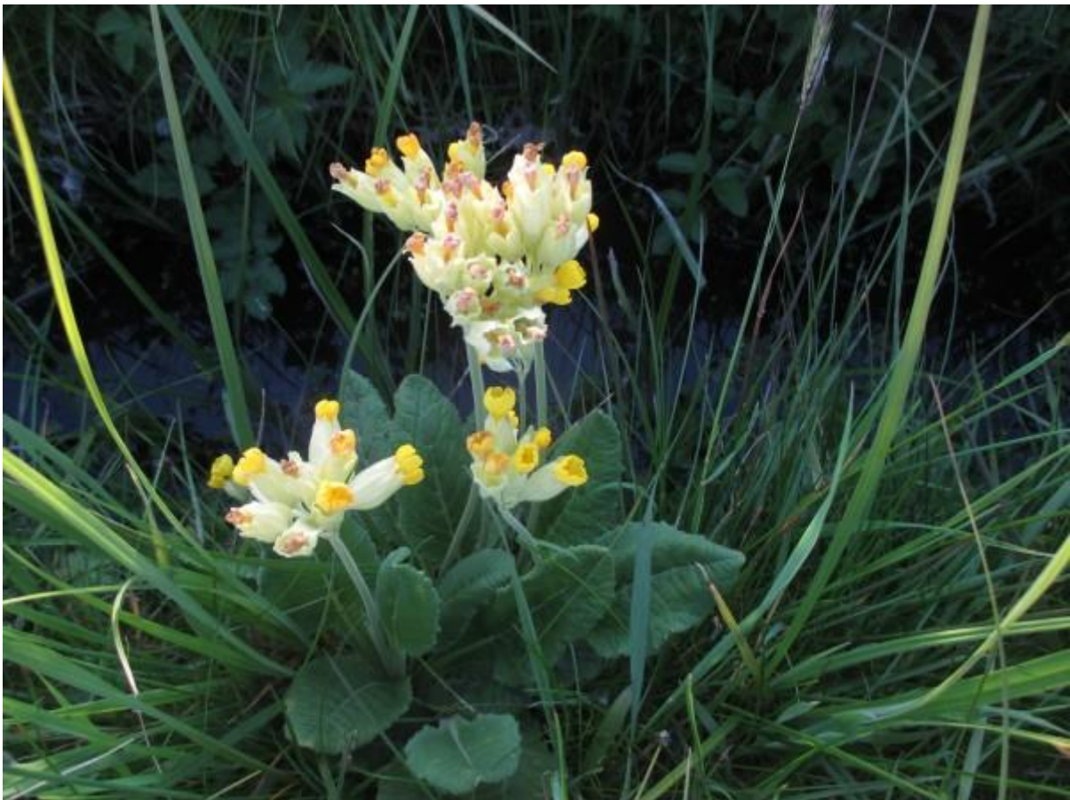
Slanke sleutelbloem in zijn nadagen