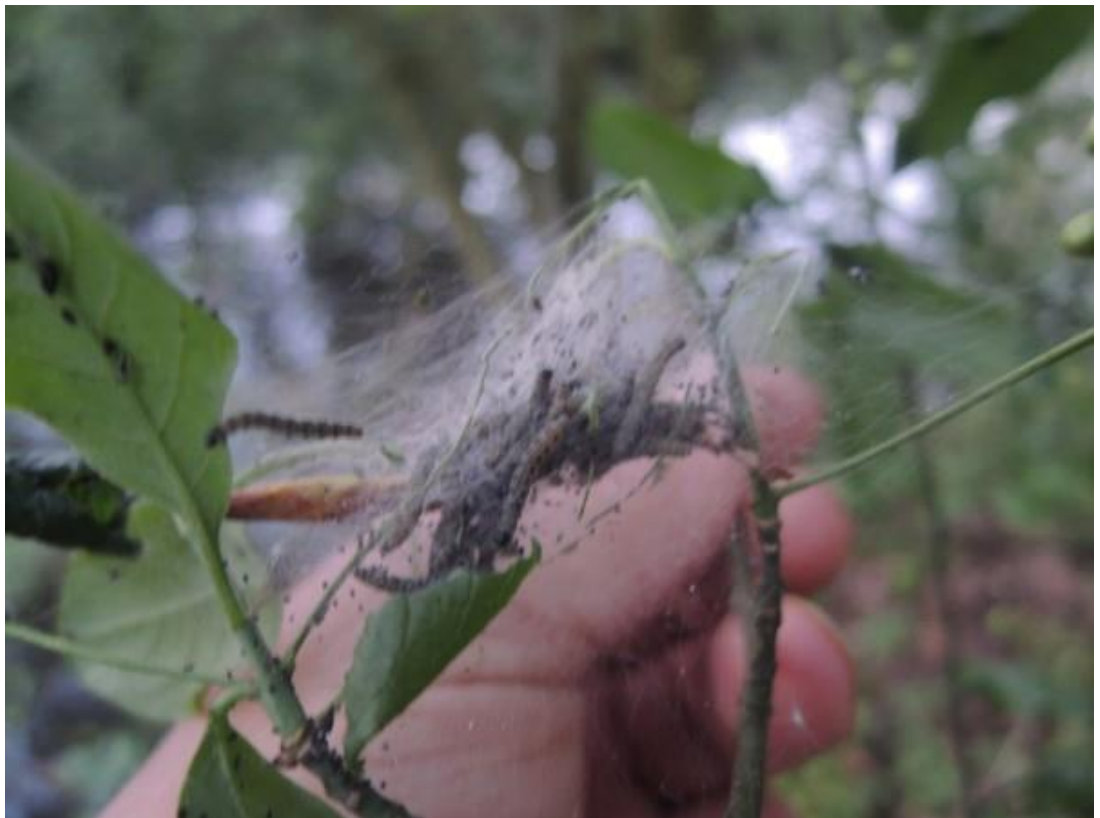
Heb je tijd van wachten dan worden dit kardinaalsmutsstippelmotten