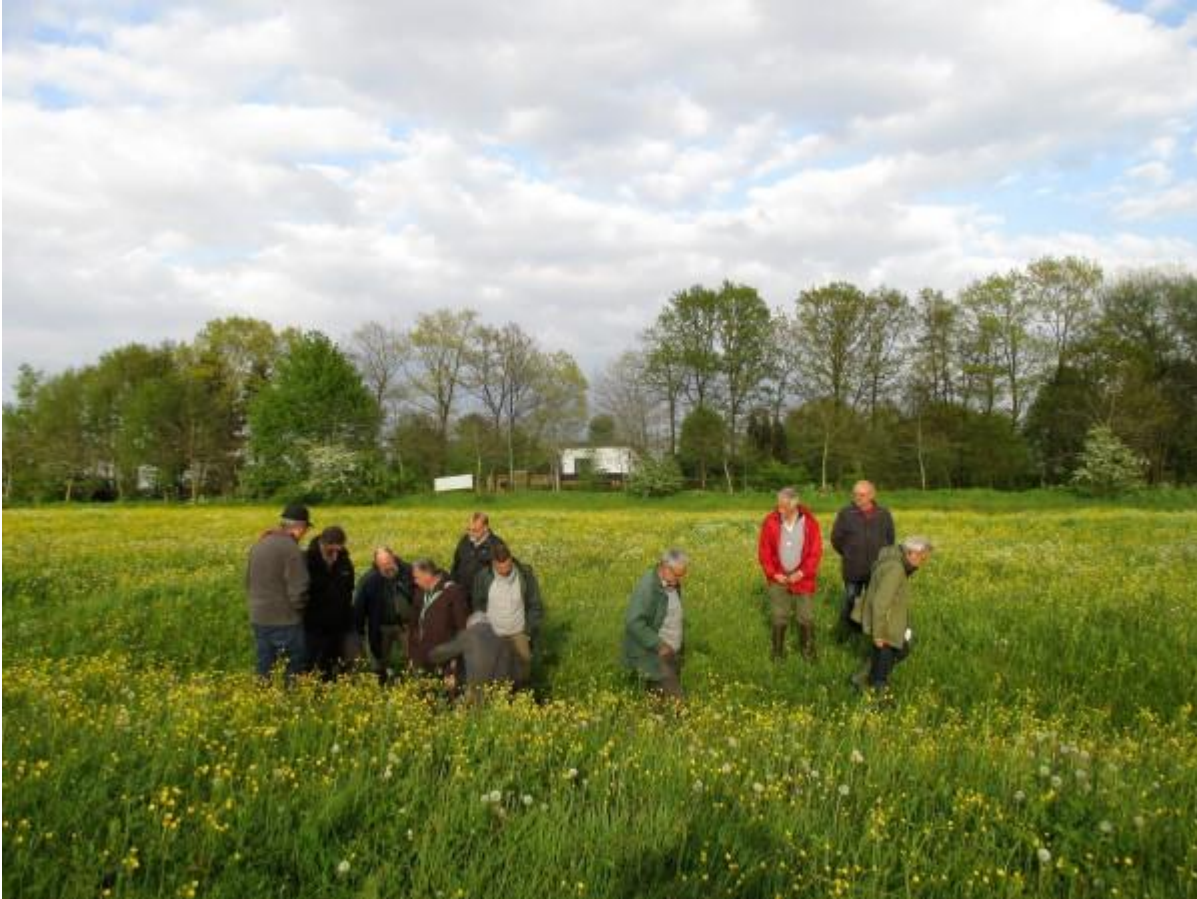
Gelukkig staan de sloten intussen terug droog!