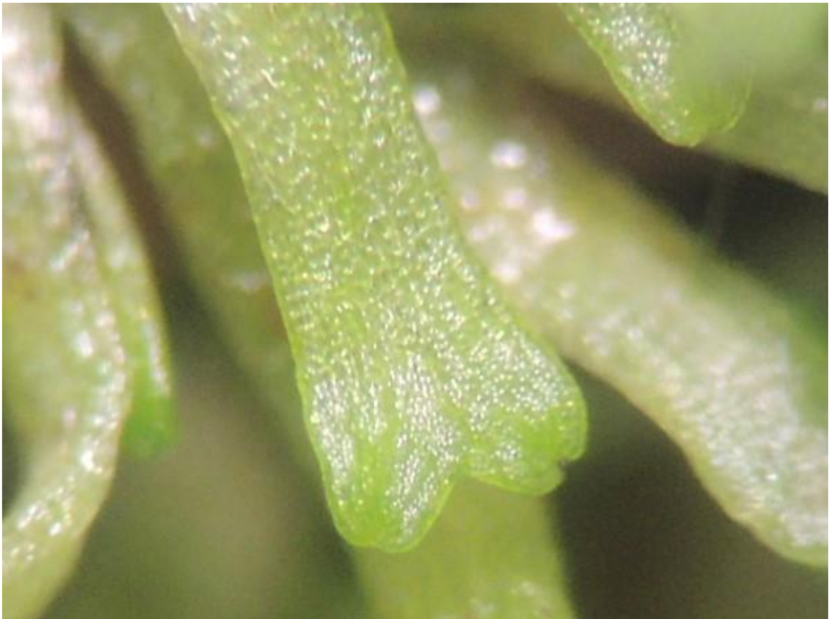
Als je een heel goeie bril heb ziet het er zo uit!