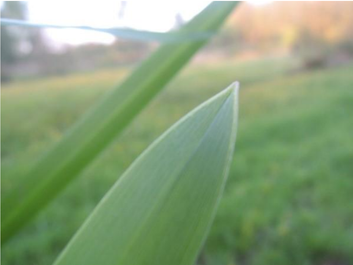
Liesgras detail van blad en tongetje