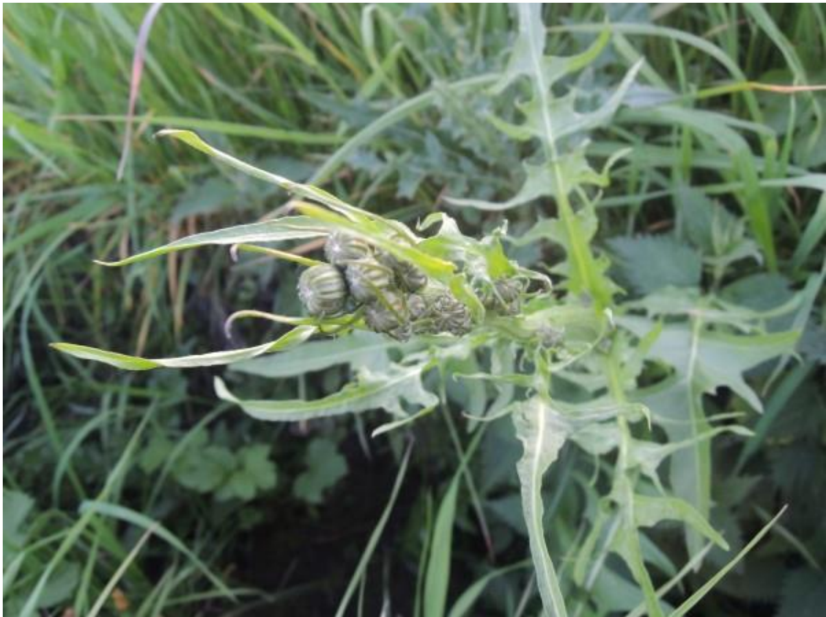
Groot streepzaad wie ze in bloei wil zien moet eens terug gaan