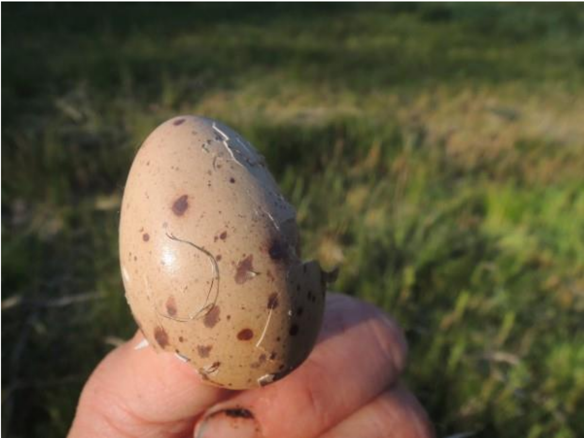
Hier is een jonge kievit uitgekomen