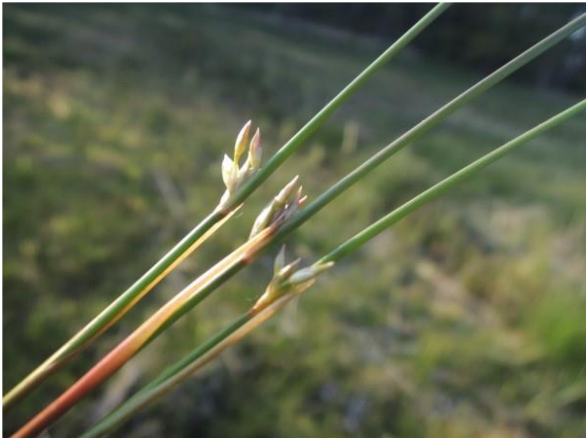
Dit zie je ook al met een gewone bril